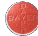
本体： おもて ・ うら