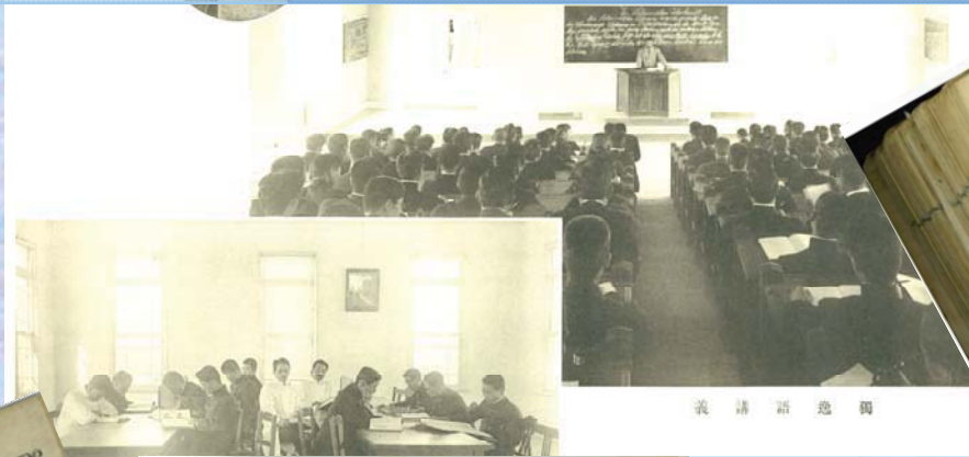
義 講 語 逸 詞