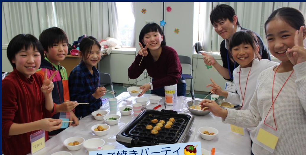
たこ焼きパーティー 🍡

2018年12月26日、第2回“10歳からのきょうだい会”に7人のきょうだいさんが参加してくれました。