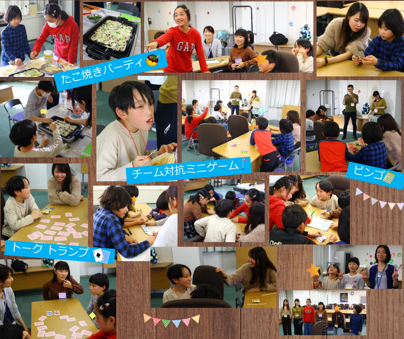
たこ焼きパーティ 🍡

8名のきょうだいさんが集まり、たこ焼きやミニゲーム、トークトランプを楽しみました。最近頑張っていることや嬉しかったこと、そして病気のきょうだいのことなど、今回も、いろいろお話を教えてくれました。みんなの大事な気持ち、教えてくれてありがとう！みんなのことたくさん応援しています。また話そうね！