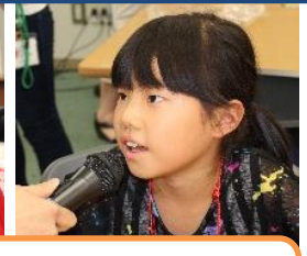
みんなのこと、たくさん知れてうれしいです！