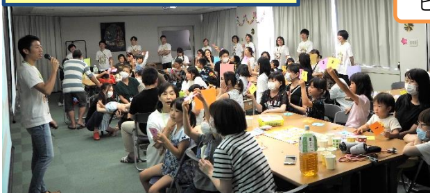
ビデオで病棟の紹介