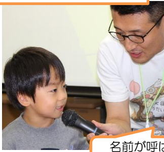
名前が呼ばれたら、インタビューです！