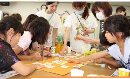
みんなの名前を並べて、お手製ピンゴをしました