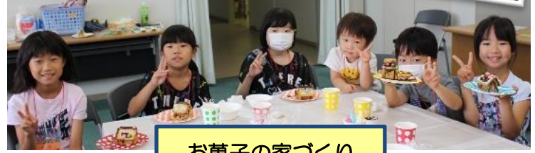
お菓子の家づくり