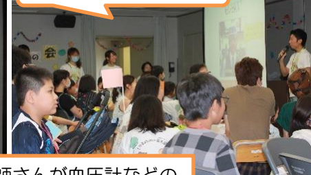
先生や看護師さんが血圧計などの使い方を教えてくださいました