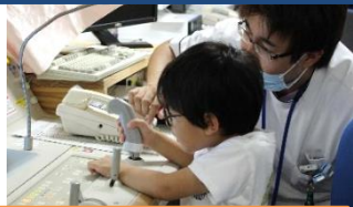
技師さんが検査のしくみを教えてくださいました