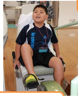
こうやって検査をしているんだよ