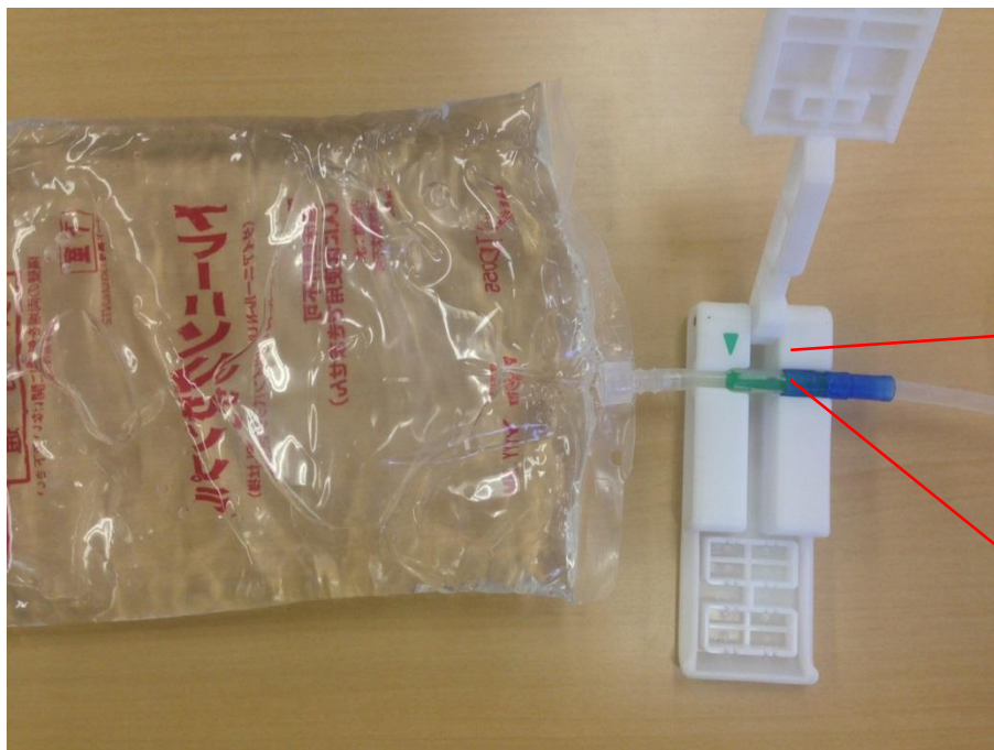
ダイアニールの場合