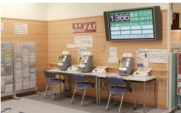
① 1F 院外処方せん(FAX) Out-of-Hospital Prescriptions (fax)