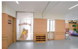
① 3F キッズルーム Children's Room