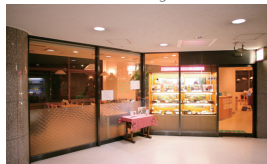
④ 1F レストラン Restaurant