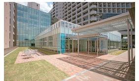
⑦ 1F オアシスキューブ(福利施設) Oasis Cube (Welfare facility)