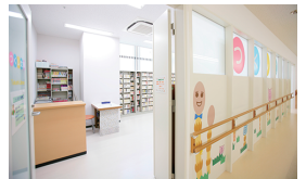
② 2F つくし文庫 Tsukushi Library