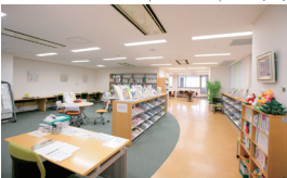
② 2F 広場ナディック Nadic Hall