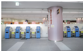
① 1F 再診受付機 Automated Check-In Machine