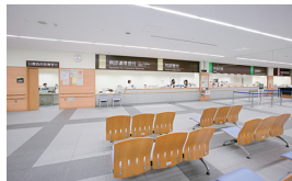
① 1F 中央待合ホール Central Waiting Hall