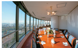
④ 14F レストラン Restaurant